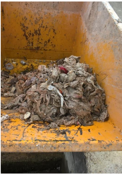
Refus de dégrillage en entrée de station d'épuration

Certains se servent des égouts comme d'une poubelle dans laquelle ils jettent toutes sortes de débris. Cela peut créer de nombreux problèmes, depuis les égouts bouchés jusqu'à des dommages causés aux équipements de la station d'épuration.